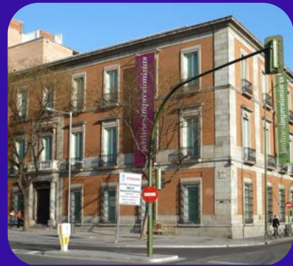
Museo Nacional Thyssen-Bornemisza