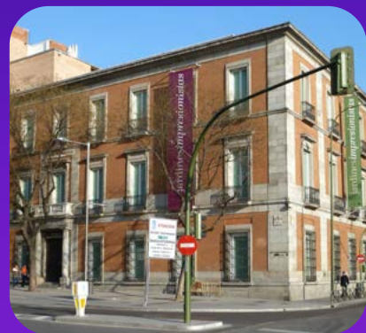
Casa Museo Lope de Vega