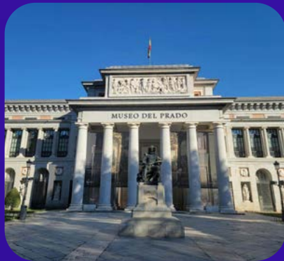
Museo del Prado