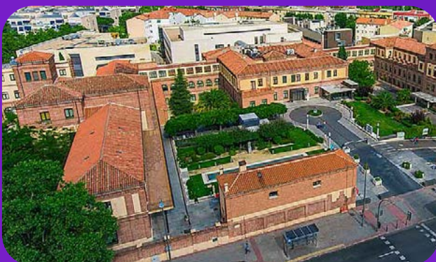
Hospital Beata María Ana C. del Dr. Esquerdo, 83, Retiro, 28007 Madrid, España