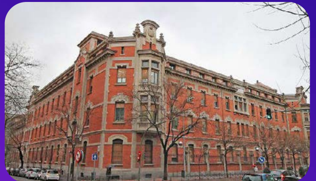
Hospital Universitario Santa Cristina C. del Maestro Vives, 2, Salamanca, 28009 Madrid, España