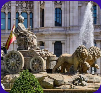
Fuente de la Cibeles