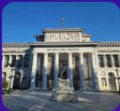
Puerta de Alcalá