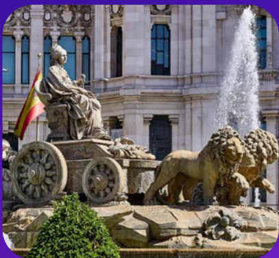
Palacio de Linares