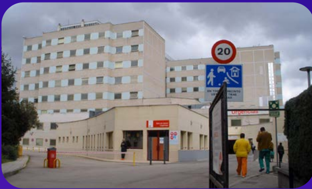
Hospital General Universitario Gregorio Marañón C. del Dr. Esquerdo, 46, Retiro, 28007 Madrid, España