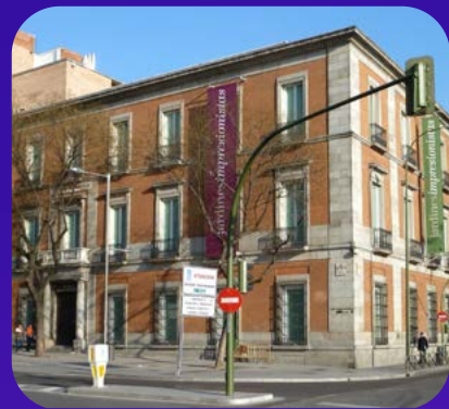
Puerta de España