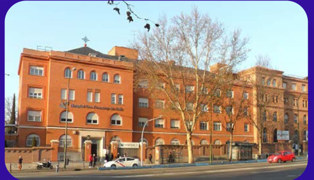
Hospital San Francisco de Asís Centro, 28013 Madrid, España